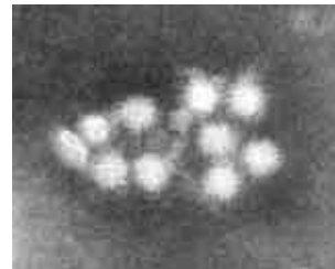
図1. ノロウイルスの電子顕微鏡像

食品を取り扱う職場等では、症状の有無に関わらず入念な手洗いや施設の衛生管理が求められます！